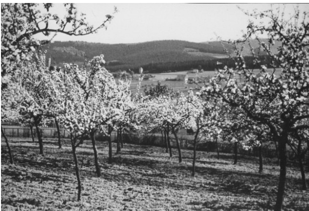
So sah es 1937, mit Blick nach Junkernhees aus.